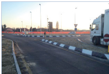
rotonda sulla statale 515 in prossimità di Capitelmozzo